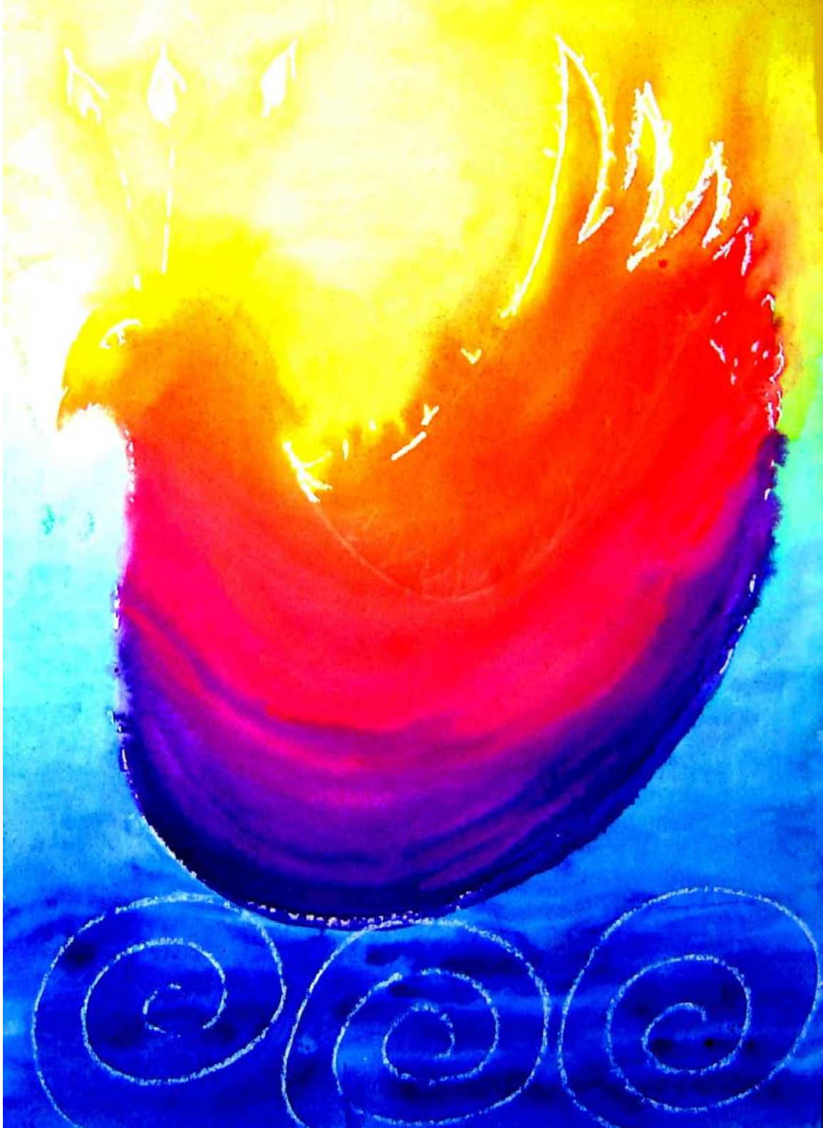
L'Ange du Pardon