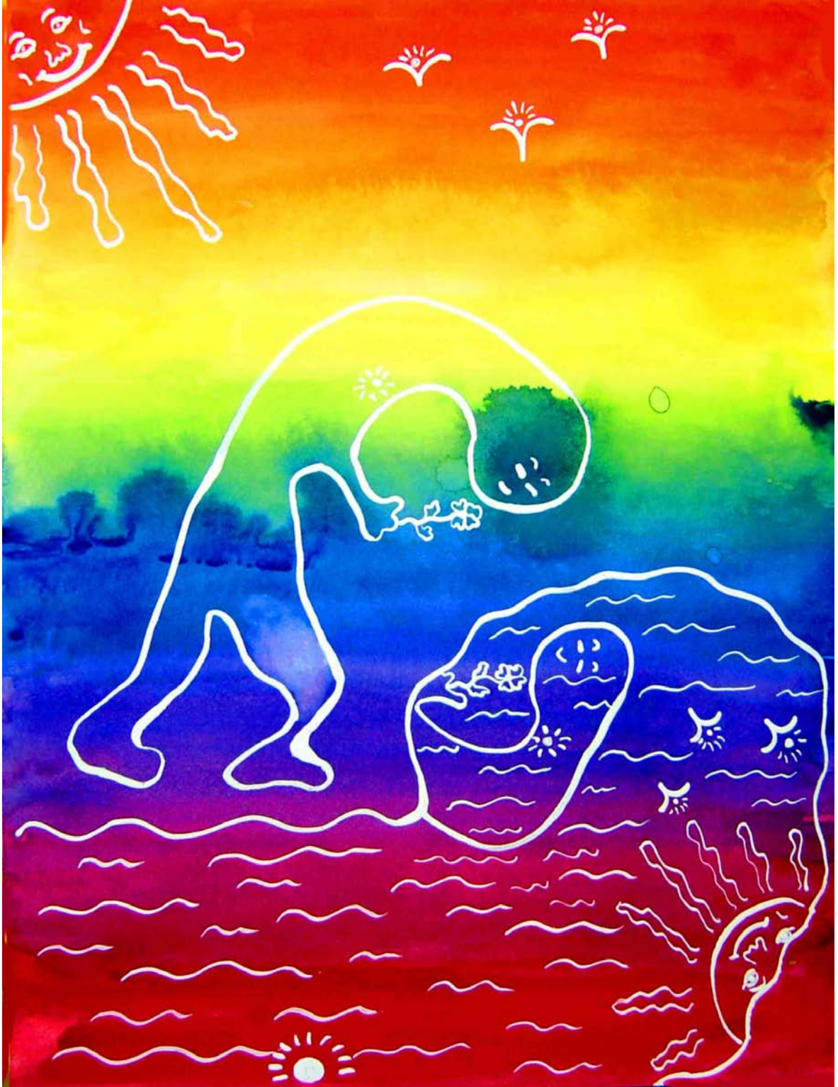
Le Miroir du Lac